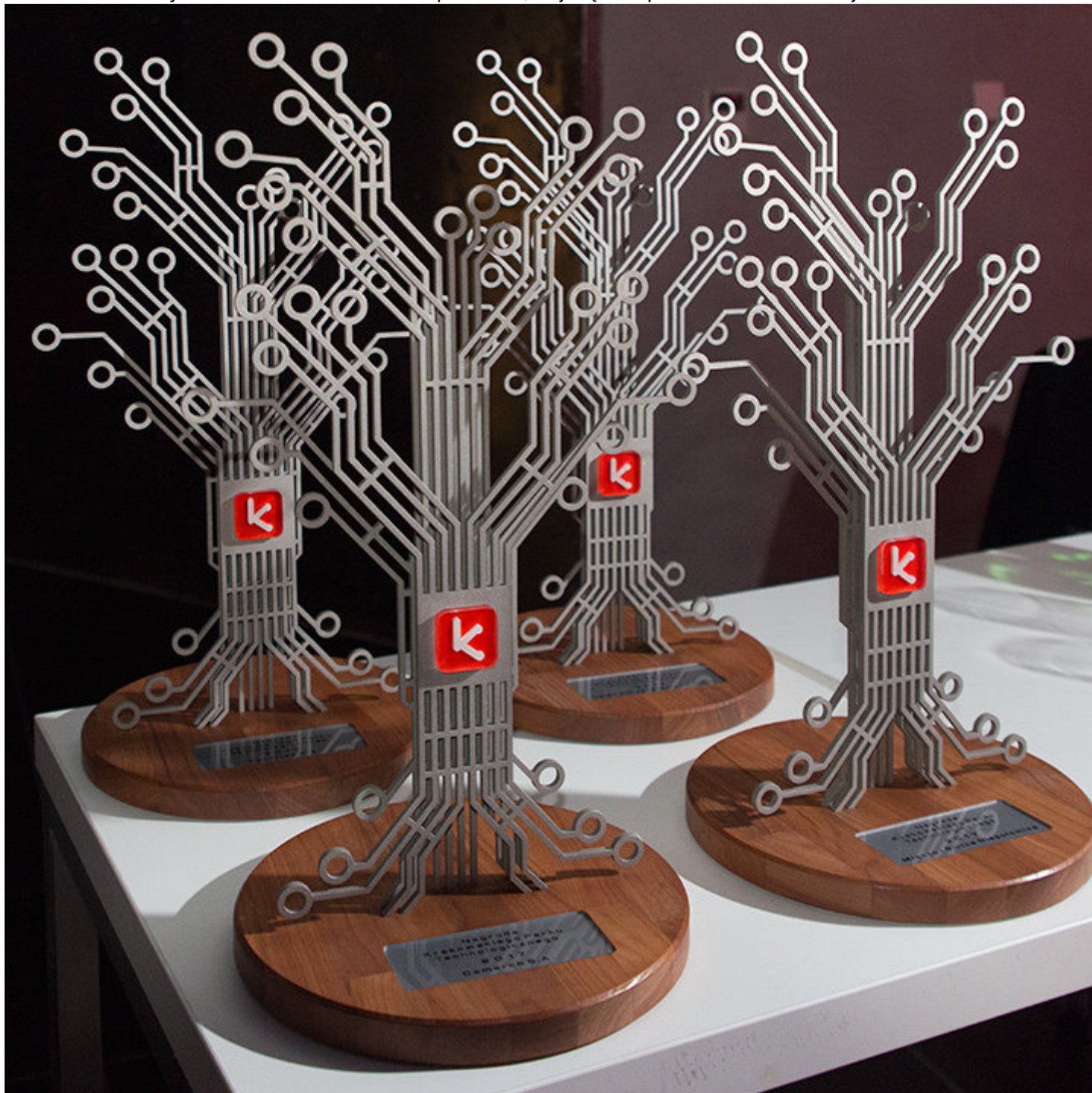
Nagrody Krakowskiego Parku Technologicznego

Ten rok był szczególnie dla Krakowskiego Parku Technologicznego. Minęło 20 lat od utworzenia spółki. Jesienne obchody 20-lecia stanowiły podsumowanie dotychczasowej działalności i stały się okazją do podziękowania firmom i instytucjom, dzięki którym sukces KPT stał się możliwy. Nagrody Krakowskiego Parku Technologicznego otrzymały firmy funkcjonujące w specjalnej strefie ekonomicznej: Comarch S.A. i Valeo Autosystemy sp. z o.o., firma-lokator KPT, która swój wielki rozwój od start-upu do prężnie działającego przedsiębiorstwa przeżyła właśnie u nas - Synerise S.A. oraz Gmina Niepołomice, największa podstrefa krakowskiej SSE.